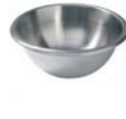
Petit Cul-de-Poule 20 cm