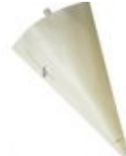
Poche à Douilles