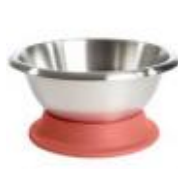
Support Cul de Poule